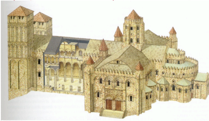
Iglesia Santiago de Compostela (1077-1211)

“La iglesia románica, casa de Dios en la Tierra, debía reflejar el orden universal que emanaba de la divinidad... su estructura debía de ir más allá de las necesidades puramente constructivas mediante la observancia de determinadas leyes simbólicas.